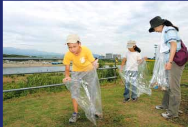
相模川周辺六市町村(海老名市・厚木市・相模原市・座間市・愛川町・清川村)で構成する「県央相模川サミット」の一環として、8月8日、六市町村合同クリーンキャンペーンを実施。海老名市では、河原口地区を会場に清掃活動を行いました。全6会場合計で6468人が参加、1万6490* g のごみを収集しました。