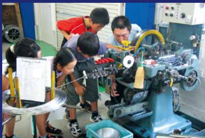
8月24日・25日、市内の製造業を見学する「ものづくり探訪隊」を実施。参加した子どもたちは、担当者からの説明に興味津々の様子で聞いていました。