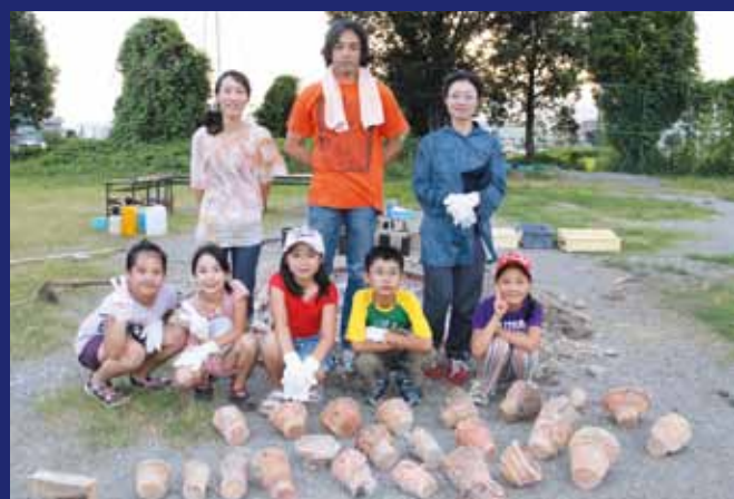
8月28日、文化財探求舎体験講座「いにしえびとの道具箱」で成形(8月7日~9日実施)した縄文土器を、市役所西側催事広場で焼き上げ、完成させました。