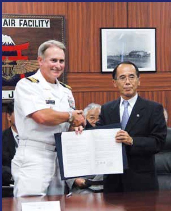
8月18日、市と米海軍厚木航空施設は、大地震・風水害および大規模事故などの災害時に相互支援を行うための覚書を締結しました。