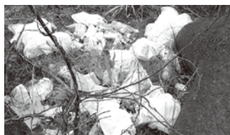
不法投棄されたみ

棄すること、山林沿いや河川敷に限らず、市で収集・処理できない物などを集積所に持ち出すことも該当します。なお、不法投棄をする、法律によって罰せられます(5年以下の懲役もしくは1000万円以下の罰金)。 このため、市では不法投棄の確認後、排出者が自主的に回収するよう注意・警告しています。 また、一斉調査などの結果(下表)から、2回以上不法投棄があったら、み集積所に、「不法投棄重点監視箇所・注意警告表示」と