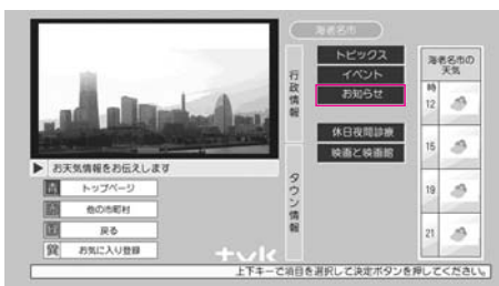
データ放送画面から「お知らせ」を選択

地上デジタル放送を活用したデータ放送番組「マイタウン情報」で、海老名の市政情報を発信しています。