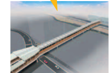
海老名駅駅間自由通路完成イメージ

海老名駅西口地区 「県央の新たな顔として」 鉄道の結節点である海老名駅。西口地区では、大型商業施設や高層住宅、オフィスなどの建築が計画され、まちづくりが大きく進展しようとしています。これにより海老名市は、県央の拠点都市として、さらに元氣あふれる魅力あるまちへと発展していきます。