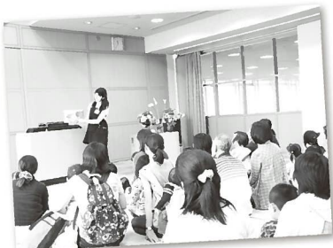
▲「おはなしひろば」の様子

回6日(木)時10時～11時30分回サークル活動の情報交換など回各サークル親子2組回名札