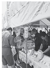
白石市・登別市の特産品が揃っています