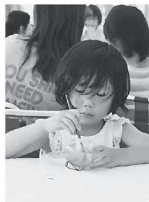
子どもに人気の絵付け体験 ぜひ親子で参加を