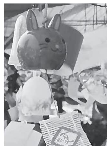
変わり風鈴を見つけるのも楽しい