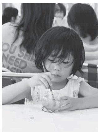
子どもに人気の絵付け体験 ぜひ親子で参加を