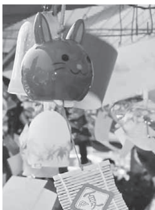
変わり風鈴を見つけるのも楽しい