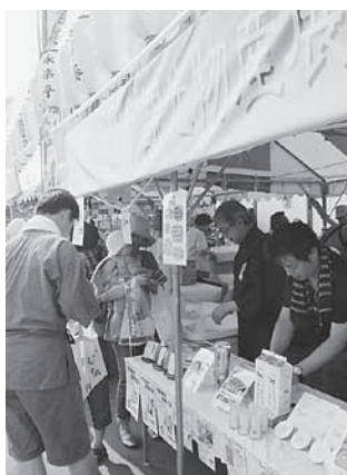
白石市・登別市の特産品が揃っています