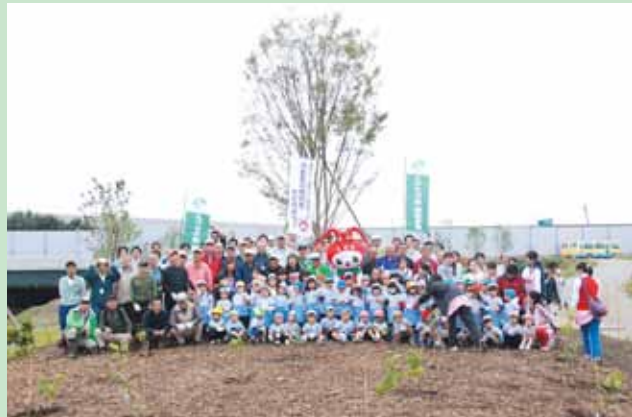
植樹後は開通前の海老名ジャンクションのループ区間を歩いて見学。貴重な体験をしました。