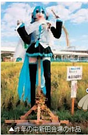
▲昨年の中新田会場の作品