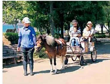
出張などがある日はお休みになる場合があります