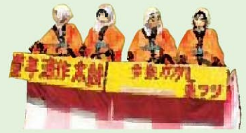
▲毎年おなじみの今泉会場の作品