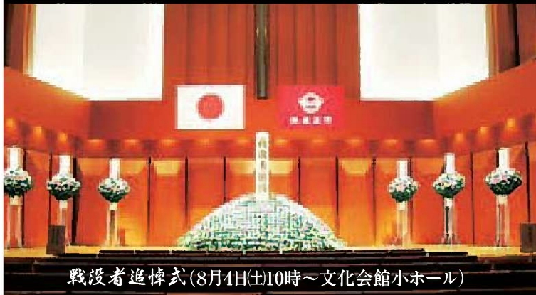
戦没者追悼式(8月4日(土)10時~文化会館小ホール)