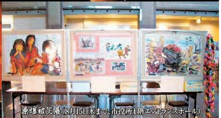
原爆被災展(8月15日(木)まで、市役所1階エントランスホール)