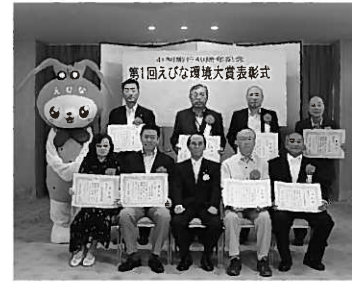
昨年の受賞者の皆さん

環境配慮活動の普及促進などを図るため、「第2回えびな環境大賞」を募集します。 ▼対象 市内在住・在勤・在学の方または市内に事務所・事業所を有する団体など