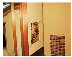
崩れ落ちた碧水園の壁(上)

まさに百聞は一見にしかず。震災を風化させることなく、継続的な支援を行っていくことが、改めて美感じた視察となりました。