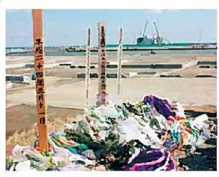
名取市日和山にて(左) ヒビが入った白石城の城壁(右)