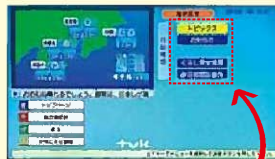
知りたい情報を選択