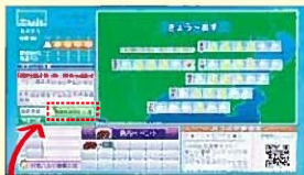
マイタウン情報を選択