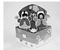
▲内容 ゆらゆらおひなさま

▼15時～16時20分 未就学児の参加できる時間は14時～16時20分です。 子どもたちが簡単な工作と遊びを楽しむ教室です。費用無料。直接会場へ。 ▼対象 小学生(未就学児も保護者同伴で参加可能ですが、小学生が多い場合はご遠慮いただくことがあります。未就学児の参加できる時間は14時～16時20分です。)