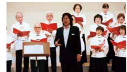
▲庄巻の歌声をお楽しみください

☎12月12日(月)12時10分から(40分程度) ☎市役所1階エントランスホール