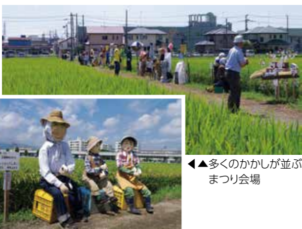
▲▲多くのかかしが並ぶまつり会場

皆さんから寄せられた力作のかかしが勢ぞろいします。 ▼期間 9月3日(土)12時～19日(月)12時 ▼その他 9月10日(土)11時から、中新田コミセンで表彰式を行います。