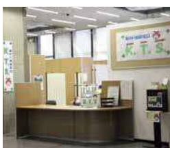
▲「K・T・S」は「かわり・つながり・ささえあい、の略

市役所1階に、障がいのある方と家族のための相談窓口を開設しました。日常の困り事や悩みについて、保健師や相談員が応じます。お気軽にご利用ください。