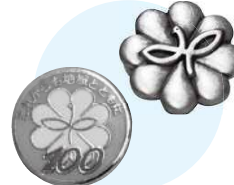
民生委員バッジ(右上)と100周年シンボルバッジ(左下) 四つ葉のクローバーとハトをデザイン