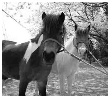
▶チョコエビ(左)とミルクビーナ(右)。海老名運動公園で待っています。

お子さんの年齢・性別・続柄・希望日(第3希望まで)・今までのポニー教室の参加回数を記入し、〒243-0422 中新田329-1-19 海老名運動公園総合体育館へ。申込書は海老名運動公園ホームページからもダウンロードできます。なお、同体育館または海老名運動公園ポニー広場で直接受け付けるほか、ファクスでも受け付けます。3月26日(日)必着。