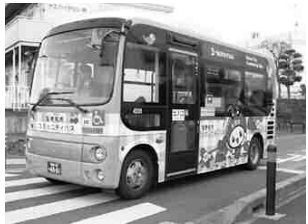
▲昨年10月に登場したえび〜にゃのラッピングコミバス

定員24人のコンパクトサイズなバス。乗り降りしやすいノンステップバスで、お年寄りや車椅子の方、小さなお子さんも安心して利用できます。運賃は、大人150円・小児(小学生以下)80円。支払いは交通系ICカードにも対応。