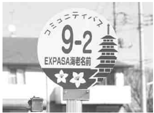
▲バス停は「七重塔」と「サツキ」が目印