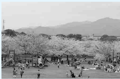
寒川町を代表する公園です。ソメイヨシノなど約70本の桜が美しく公園を彩ります。「寒川郵便局前」下車徒歩5分