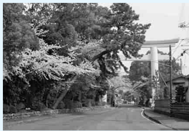
約1kmにおよぶ参道の両側を桜が覆い、行き交う人々の目を楽しませてくれます。「かながわの花の名所100選」にも選定されています。「寒川神社参道」下車