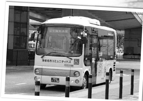
市内を走るコミバスの運行ルートは、「国分ルート」「上今泉ルート」「大谷・杉久保ルート」の3路線。運行ルートや時刻表などの詳細は、都市計画課(☎235・9676)または市ホームページをご覧ください。