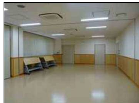
（市民開放型の会議室）