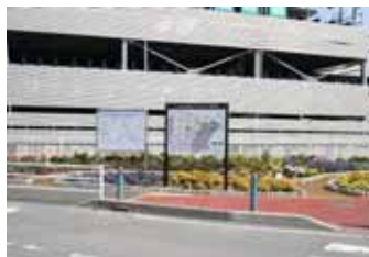
案内板の設置状況(かしわ台駅前)