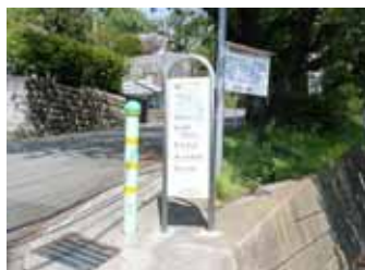
案内板の設置状況(国分北)