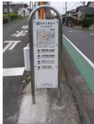
案内板の設置状況(上今泉)