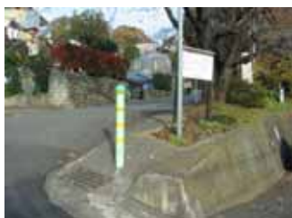
案内板の設置前状況(国分北)