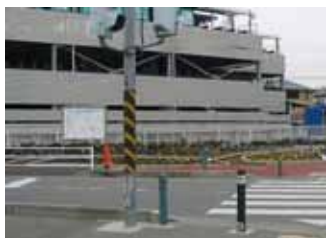
案内板の設置前状況(かしわ台駅前)