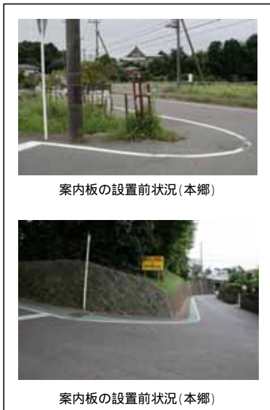
案内板の設置前状況(本郷)