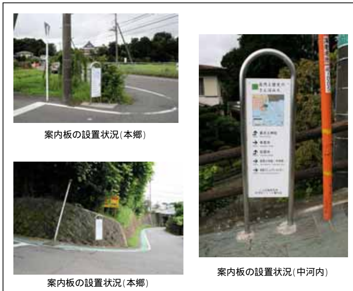
案内板の設置状況(本郷)