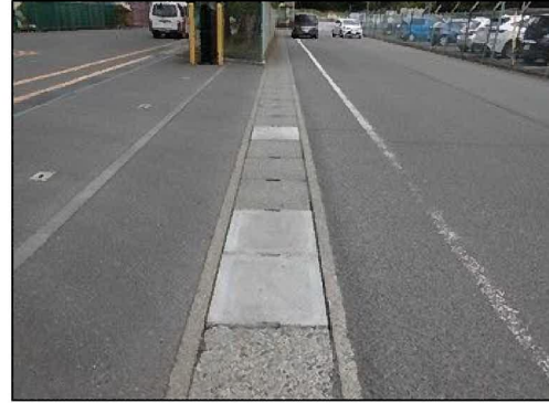
側溝の蓋の破損（蓋交換後）