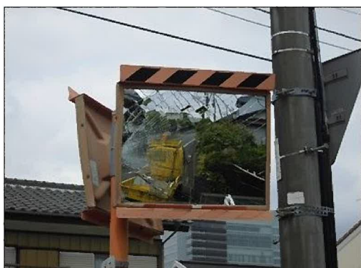
安全施設の補修（カーブミラー補修前）