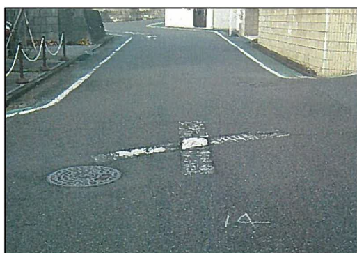
安全施設の補修（区画線補修前）