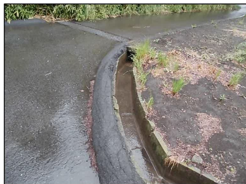
側溝清掃（落ち葉除去後）