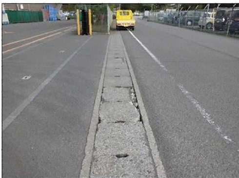
側溝の蓋の破損（蓋交換前）