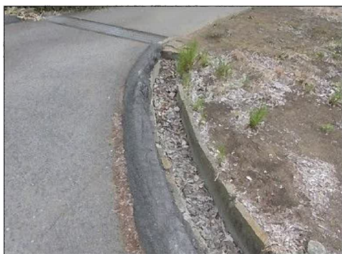
側溝清掃（落ち葉除去前）