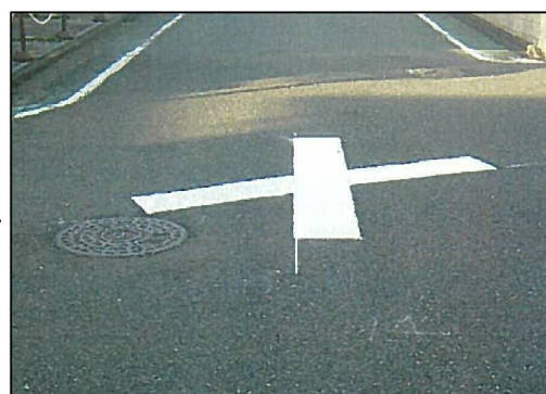
安全施設の補修（区画線補修後）