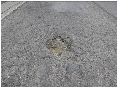
舗装補修（穴埋め前）