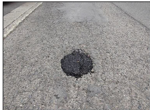
舗装補修（穴埋め後）