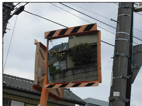
安全施設の補修（カーブミラー補修後）