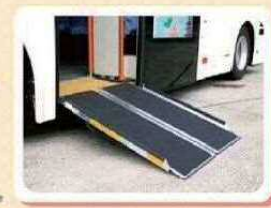
スロープ板装着時