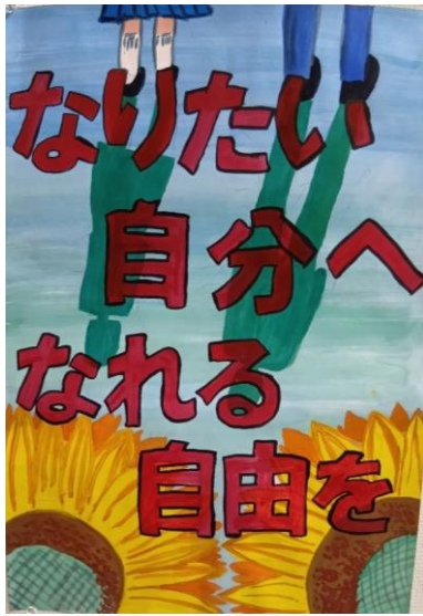
令和7年度 海老名市中学生 人権ポスターコンテスト 市長賞