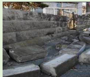
大谷石の塀 (東日本大震災)