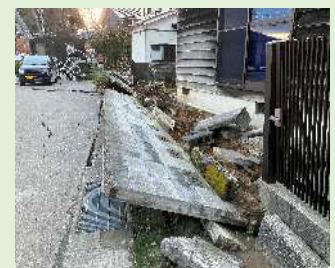
ブロック塀 (能登半島地震)