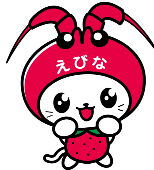
海老名市イメージキャラクター えび～にゃ