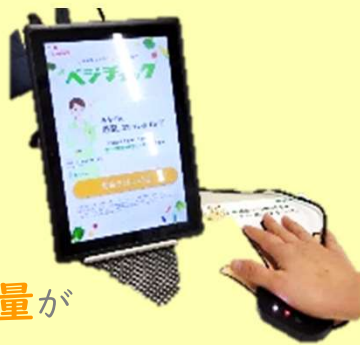
写真：野菜の摂取量測定器