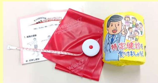
例：体操用セラバンド、トイレットペーパー、 メタボチェックメジャー