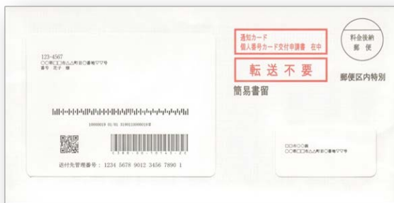
[Cartão de Notificação]