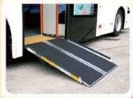
スロープ板装着時