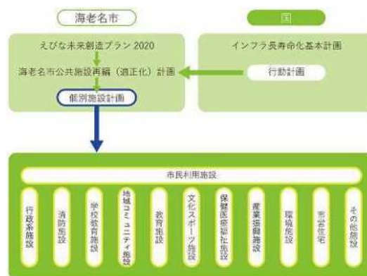
■個別施設計画の体系図

今回、再編計画を令和6年2月に改定したことに合わせて、下位計画である個別施設計画においても、現状の把握・分析を行い、施設のあり方について再検討しました。