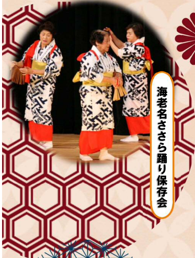
海老名ささら踊り保存会