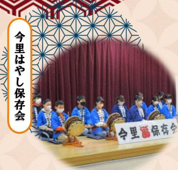
今里はやし保存会