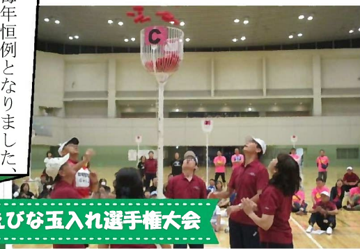
えびな玉入れ選手権大会

毎年恒例となりました、えびな玉入れ選手権大会も今年で14回を迎えました。台風の影響もありキャンセルが出てしまいましたが、参加者は、ファミリー・ジュニア・シニア・レディース・一般の5部門で合計126チーム約75名となりました。各部門、タイムを競い熱戦が繰り広げられました。今年も入賞チームには豪華な賞品が用意されました。