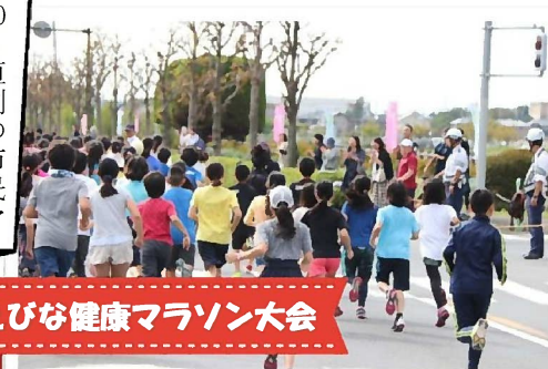
えびな健康マラソン大会

10月20日恒例の市民マラソン大会が曇り空のもと、開催されました。6km・3km・2km・1kmの4部門に幼児から高齢者まで総勢1,552人の市民が参加しました。自己記録更新を目指し真剣に走るランナーからマラソン大会を親子で楽しむ家族連れなどそれぞれに楽しんでいました。スポーツ推進委員は、立哨業務を中心に公道を走る参加者の安全確保のため大会運営に携わりました。