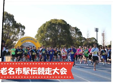
海老名市駅伝競走大会

「ニュースポーツランド」を総合体育館で実施しました。ニュースポーツの紹介、体験として、パラリンピックの正式種目のボッチャをはじめ、えび玉、バンブーダンス、大縄跳び、パラシュートを実施しました。簡単なルール説明を聞いて、来場者で即席チームを作ったりして、楽しく真剣にニュースポーツを体験していました。