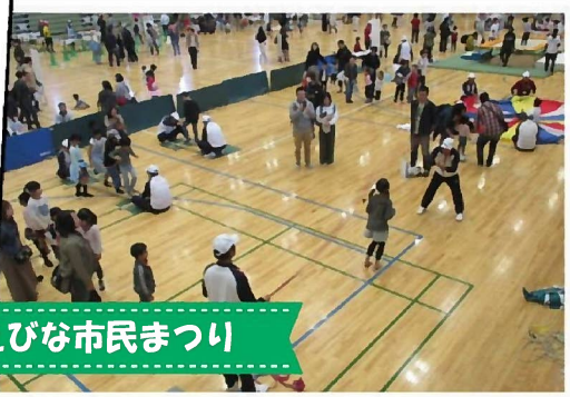
えびな市民まつり

「ニュースポーツランド」を総合体育館で実施しました。ニュースポーツの紹介、体験として、パラリンピックの正式種目のボッチャをはじめ、えび玉、バンブーダンス、大縄跳び、パラシュートを実施しました。簡単なルール説明を聞いて、来場者で即席チームを作ったりして、楽しく真剣にニュースポーツを体験していました。