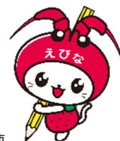
海老名市 イメージキャラクター えび～にゃ