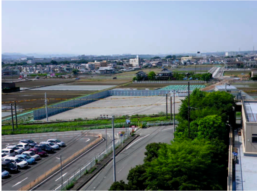
【JR相模線東側 図書館屋上より】 H29.5着手前