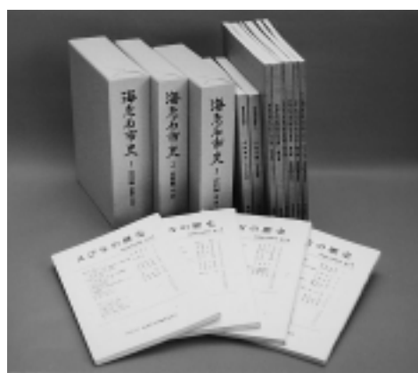
地下売店などでお求めを

市では、海老名の歴史に関する各種書籍を発行しています(下表参照)。これらの書籍は、市役所地下売店または(内)田屋書房厚木ビブレ店(地元関連書籍のコーナー)で発売しています。残部が少ないものもありますので、お早めにお求めください。