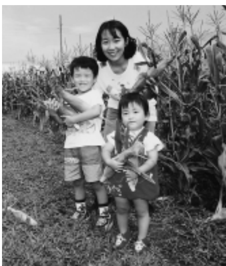
旬の味覚をもぎとろう