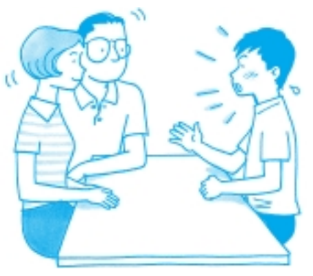
気持ちや言葉で表現させることが大切

トラブル解決へ消費者契約法のポイント 商品やサービスが多様化するなか、消費者と事業者の契約上のトラブルが増えています。そのトラブルを解決するためのルールを定めたのが消費者契約法(平成13年4月1日施行)ですが、次のような状態での契約を取り消す場合に当てはまります。 ①契約した内容と説明が違っていた場合(不実告知) ②不確かな見通しのあるものを「絶対にもうかる」といったような誘い文句で契約させられた場合(断定的判断) ③消費者が損をすることをわざと告げなかった場合(故意の不告知) ④契約した後に帰らせてもらえなかった場合は、帰ってくれなかった場合 ※この法律適用は、今年4月1日からの契約です。 ●週5日・電話と面接で消費者生活相談 市では、4月から消費者の保護と救済・被害の未然防止を図るための相談を週5日(月～金)行っています。 ▽相談日時 月～金曜日の午前10時～午後4時(閉庁日) と、正午～午後1時を除く) ▽相談方法 面接(場所) 市民相談室 および電話(☎292・1000)直通。 ☎ 商工課(内51)。