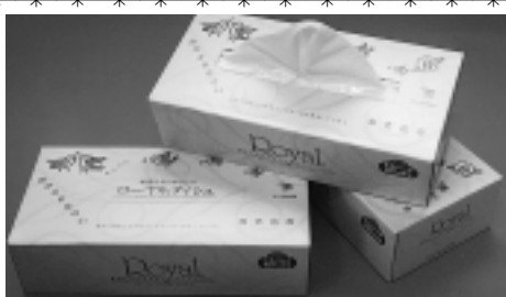
牛乳パックで生まれ変わったティッシュ

市では、資源として市内で回収した牛乳パックを原料に、オリジナルブランドのボックスティッシュ「おかえりなさい」を作成しました。ボックスティッシュ1箱を作成するためには牛乳パックおよそ10枚が必要です。平成11年度