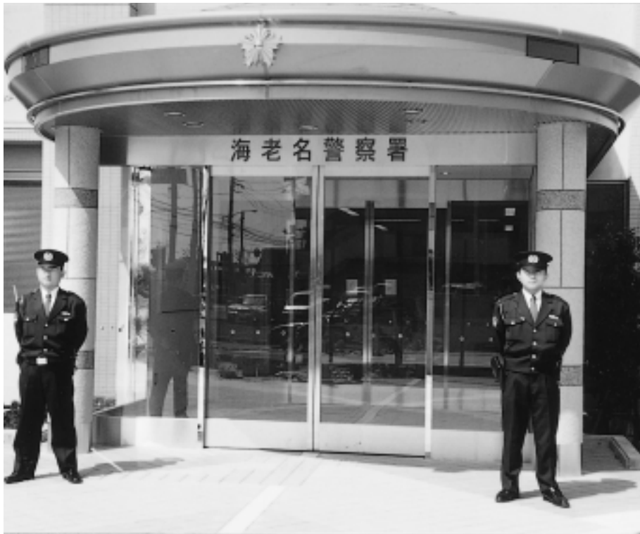
警察署の正面玄関

防犯・交通安全の強化のため、以前から設置が強く望まれていた海老名警察署が5月1日(火)に開署し、警察署業務が始まります。また、同日海老名市交通安全協会も海老名消防署前に事務所を設けて業務を開始します。