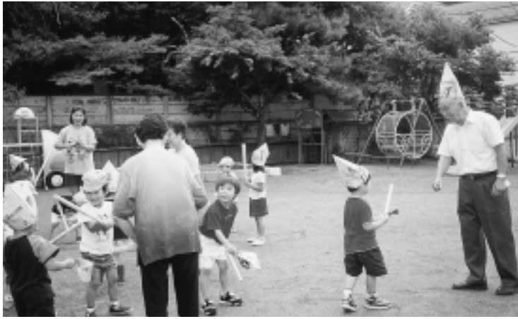
勝瀬保育園で行われた世代間交流会