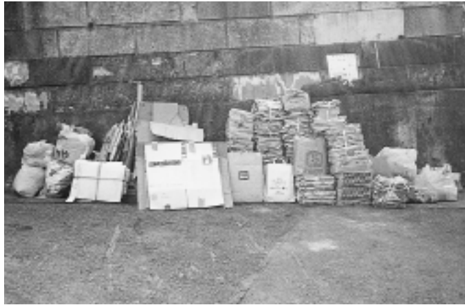
朝8時30分までに整然と並ぶごみの集積所