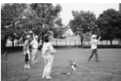
羽根付きボールをクラブで打ちます

高齢者の方の健康づくり促進事業の一環として、平成12年度第2回ターゲットバードゴルフ競技会を開催します。 ターゲットバードゴルフは、ゴルフをミニ化した競技で、誰でも気軽に楽しめるニュースポーツです。合成樹脂製の羽根付きボールをゴルフクラブで打つため大変そう快感があり、手軽にゴルフのたいご味を楽しめます。 ハンディキャップ制で男女別に表彰しますので、女性の方も気軽に参加ください。 ▽日時 3月8日(木) 午前10時から 予備日 14日(水) ▽集合 午前9時45分 ▽会場 海老名運動公園プール隣芝生広場 ▽対象 市内在住60歳以上の方 ▽持ち物 ピッチングウェッジ(ゴルフクラブ) ▽その他 終了は午後1時を予定しています。昼食は必要に応じて各自でご用意ください。 ◎ はがきに住所氏名・電話番号・年齢を明記し、2月20日(火)までに、〒243-0492 高齢福祉課ターゲットバードゴルフ係へ ◎ 高齢福祉課(内463)。