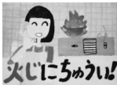
田澤 聖さんの作品