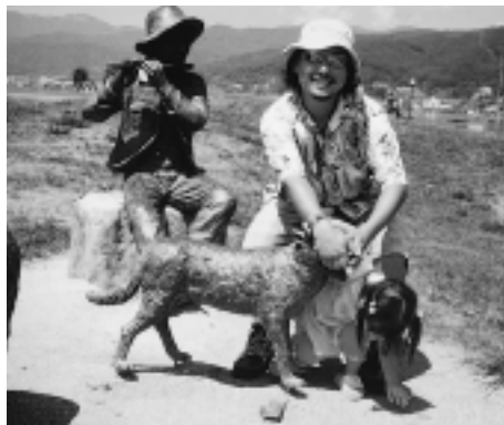
▲湖畔公園で娘さんと

「ふれあいの森」を利用したい場合は、料金(右表)を添えて、直接青少年会館の窓口で申し込んでください。宿泊の申し込みは4月20日から11月15日まで、日帰りの申し込みは4月1日から11月30日までです。空室状況は、9月までの広報えびな(毎月1日号)に掲載するほか、電話で同会館へ照会することもできます。