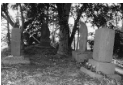
阿弥陀如来塔他四基の石仏群

望地交差点から綾瀬市境の道を大塚方面に進み、赤坂を登り切って少し行くと同名のバス停がある。その傍らに、総高百八十六寸もある不動塔がある。本体の不動明王像は欠損が激しく、昭和四十二年頃現在のものに替えられた。