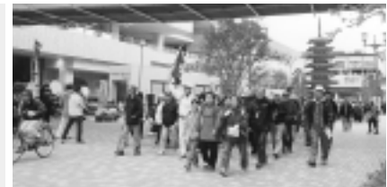
去年も大ぜいが参加！