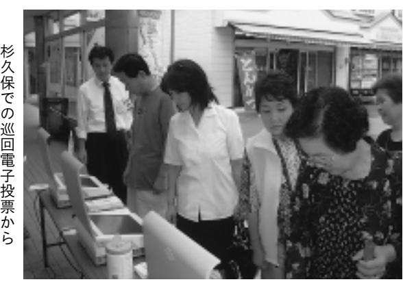
杉久保での巡回電子投票から

市・海老名商工会議所では、消費者サービス事業の一環として、市内統一大売出し事業「海老名プレミアム映画祭スタンプラリー」を9月13日(土)から10月13日(祝)まで実施します。 海老名市内のスタンプラリー参加店で買い物をし、スタンプの押印を受け、すべて異なるお店のスタンプを3個集めると、ハリウッドツアー、北海道旅行、ユニバーサルスタジオジャパン、映画鑑賞券、その他特別賞など素敵な賞品が当たる抽選を受けられます。 ラリー参加店には、のぼり旗またはステッカーを掲示します。なお、参加店舗の一覧は海老名商工会議所ホームページ(http://www.ecci.or.jp)へ掲載します。 抽選、当選者の発表および賞品の引き換えは11月3日(祝)午後1時30分から海老名中央公園で行います。当日ご来場できない当選者へは、後日賞品を送付します。 ④ 海老名商工会議所(☎231・5865)。