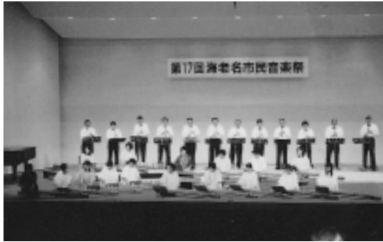
去年の祭典から(左)由香和会と(右)えびな・小町太鼓のみなさん