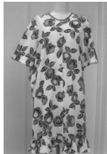
▶リフォームで湯上がり着を作ってみませんか

▽時間 午後1時~3時 ▽対象 市内在住の方・毎回10人程度 ▽持ち物 修理したい自転車・ぼろきれ ▽参加方法 電話または直接同プラザへ。