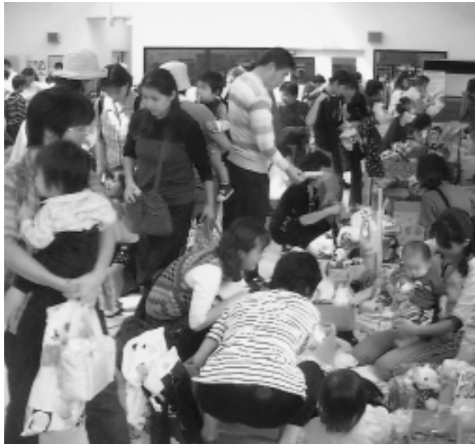
去年、好評のフリーマーケット風景