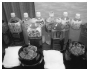
ソフトドリンク飲み放題