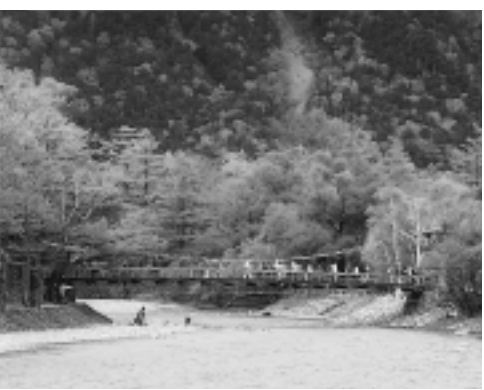
去年の秋に行われた上高地バスツアーから

☎ 4月15日(火)から電話 で(株)海老名公共サービス ☎234・ 6400、担当中島(前田)へ。 受付 午前9時～午後8時(毎火 曜・5月12日は午後5時まで)