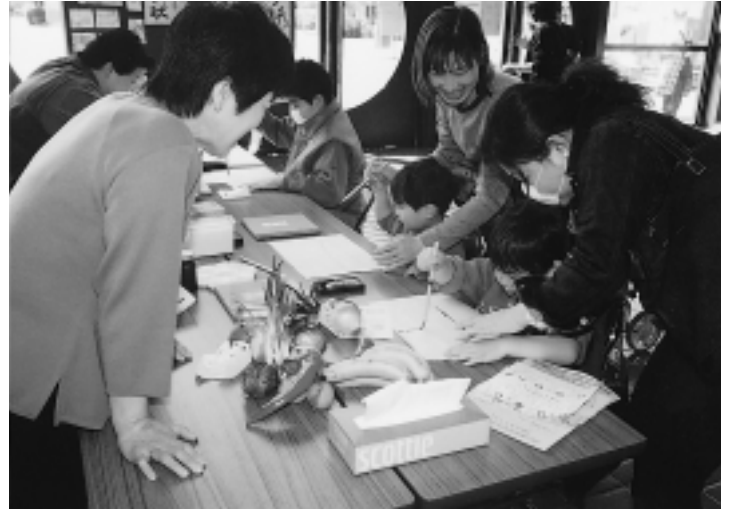
家族でにぎわう体験コーナー(去年のまつりから)