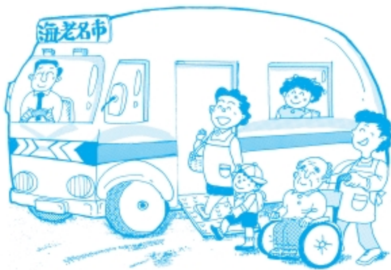
バスは「利用者にもやさしく」をモットーに